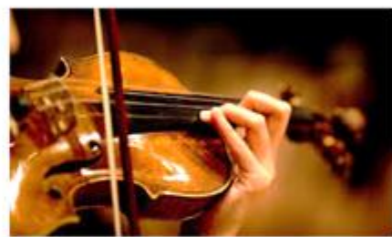
Το δοξάρι τρίβεται στις χορδές.