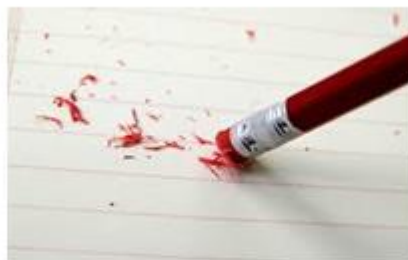
Η γόμα τρίβεται στο χαρτί.